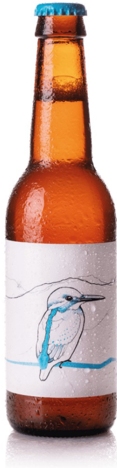
Blauet de la cervesera Terra Aspra.

Per exemple, la cervesa Blauet , utilitza un llúpol tropical, que li dona un aroma a mango i maracujà, i recorda el color blau de les platges tropicals on i encaixa perfectament el Blauet, l'ocell més "tropical" de La Garrotxa.