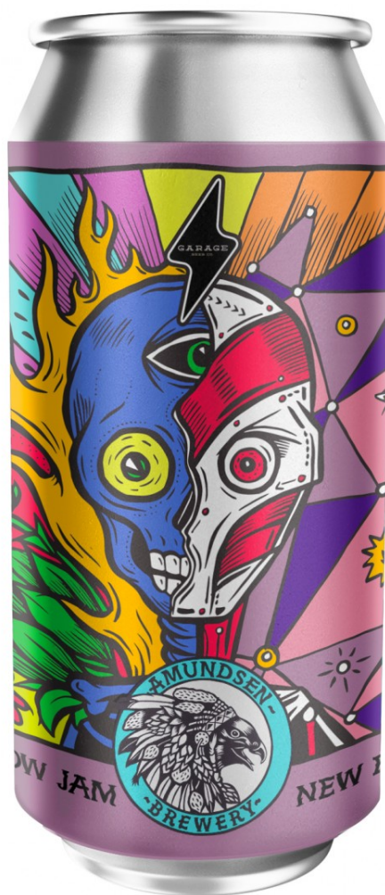
Cyborg d'Amundsen, disseny de Peter-John de Villiers.