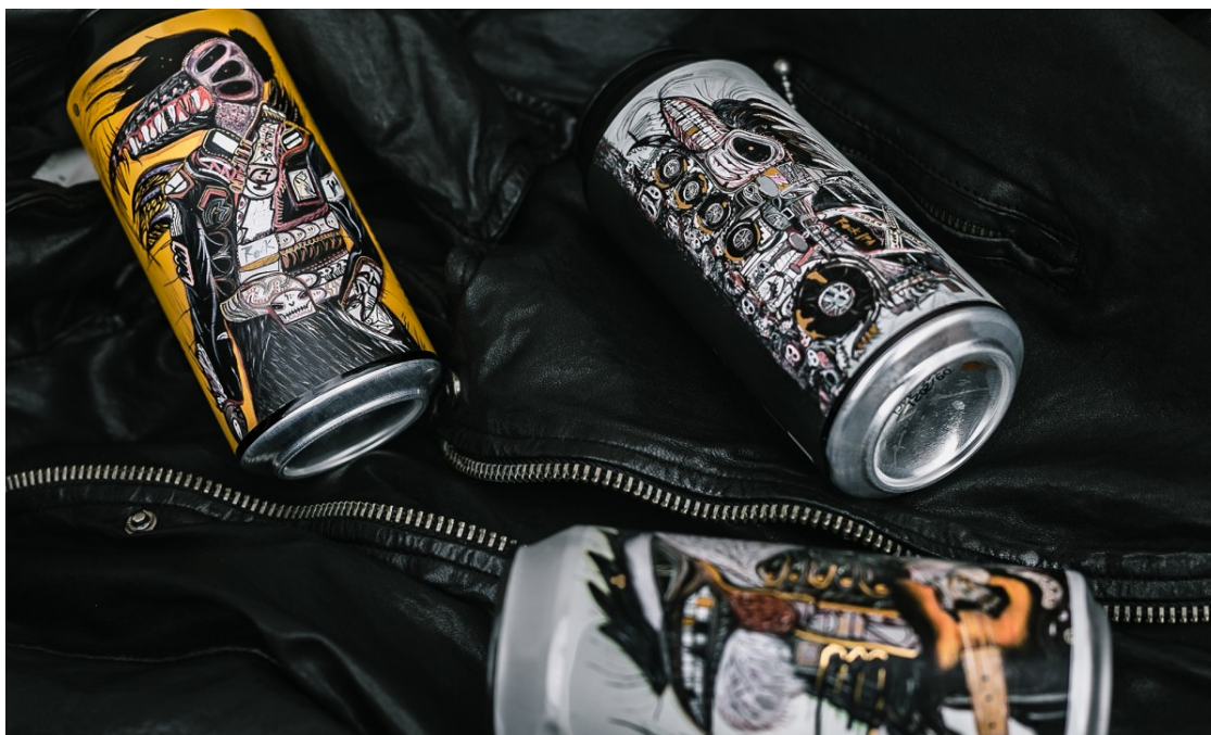
Golden Promise Brewing disseny d'Abdul Vas.

Actualment estan treballant en un nou projecte conjunt on el packaging de les llaunes inclou una obra de l'artista. Sens dubte una proposta molt original. Tal com ens explica l'Alexander, la rebuda d'aquest nou pack d'edició limitada ha estat tot un èxit. Fins i tot ens comenta que gent que no consumeix habitualment cervesa l'ha adquirit, per a ells mateixos o per fer un regal. És art!