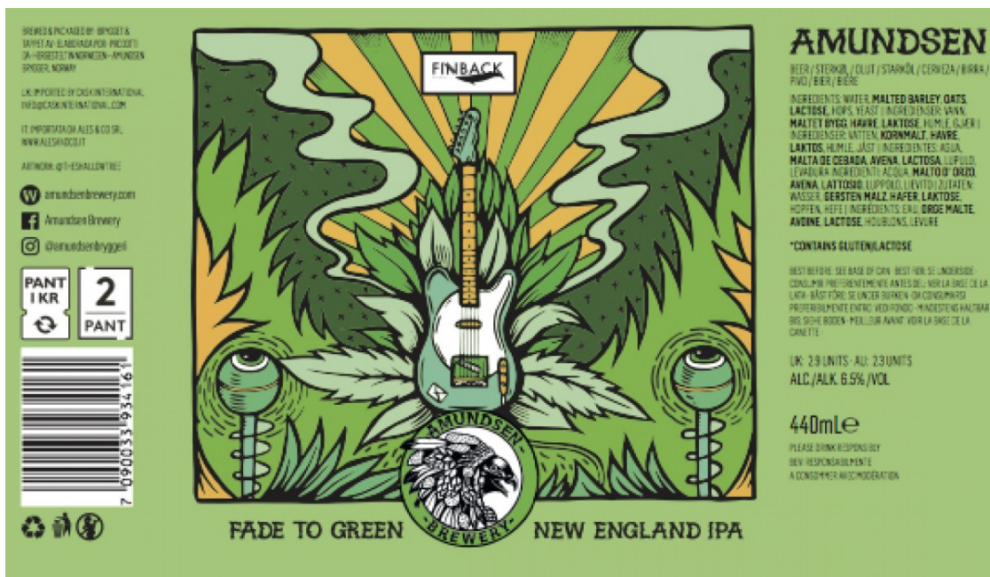
Etiqueta fade to green d'Amundsen, disseny de Peter-John de Villiers.