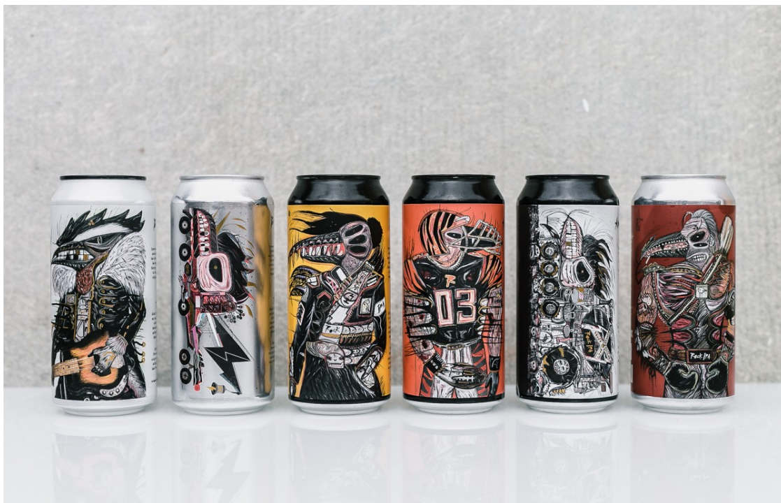
Golden Promise Brewing disseny d'Abdul Vas.