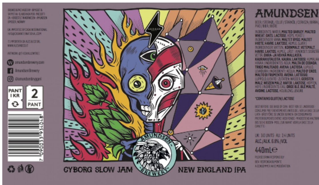
Cyborg d'Amundsen, disseny de Peter-John de Villiers.