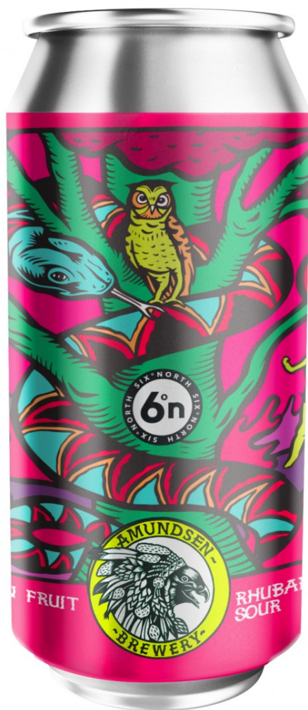
Forbidden Fruit d'Amundsen, disseny de Peter-John de Villiers.