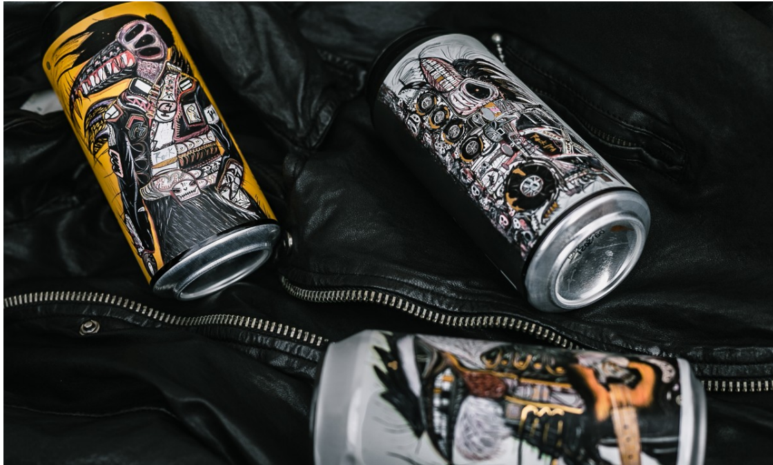
Golden Promise Brewing disseny d'Abdul Vas.

Actualment estan treballant en un nou projecte conjunt on el packaging de les llaunes inclou una obra de l'artista. Sens dubte una proposta molt original. Tal com ens explica l'Alexander, la rebuda d'aquest nou pack d'edició limitada ha estat tot un èxit. Fins i tot ens comenta que gent que no consumeix habitualment cervesa l'ha adquirit, per a ells mateixos o per fer un regal. És art!