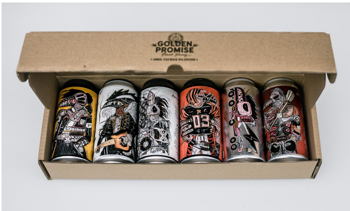
Golden Promise Brewing disseny d'Abdul Vas.