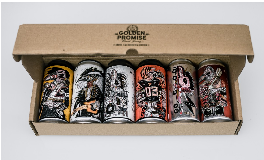
Golden Promise Brewing disseny d'Abdul Vas.