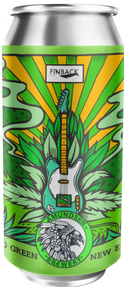
Fade to green d'Amundsen, disseny de Peter-John de Villiers.