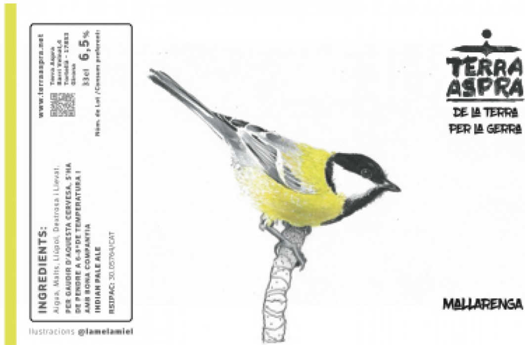
Etiqueta Mollarenga de Terra Aspra.