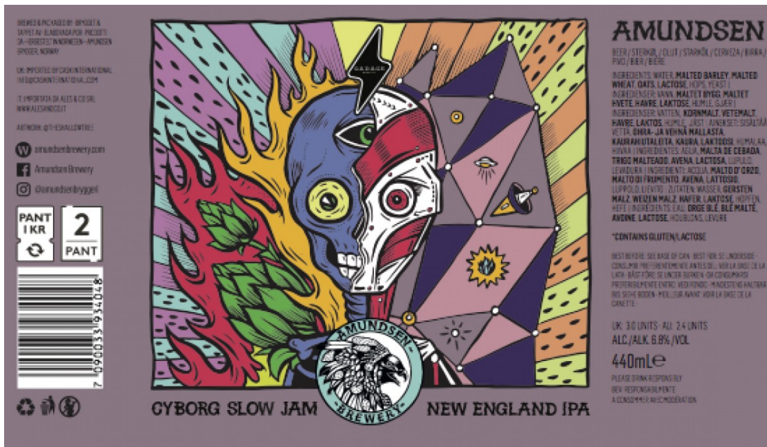
Cyborg d'Amundsen, disseny de Peter-John de Villiers.