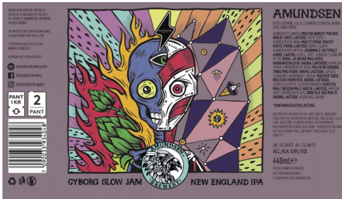
Cyborg d'Amundsen, disseny de Peter-John de Villiers.