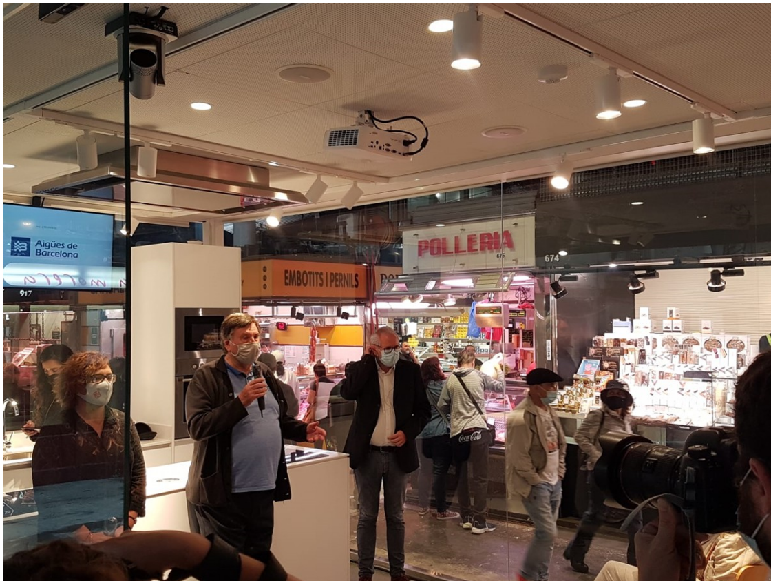
Espai Boqueria.

i ha estat possible alliberant una illa de parades que havia quedat buida perquè els negocis havien tancat o s'havien traslladat. En conjunt, s'han enderrocats 14 parades que hi havia en aquest àmbit, que ocupaven 10 negocis diferents, s'ha millorat la senyalització del mercat recordant les conductes prohibides al recinte, i facilitant l'orientació per accedir als serveis i espais del mercat (lavabos públics, aparcament, desfibril·ladors, oficines d'atenció, aula gastronòmica, etc..) per tal de fer més fluïda la circulació. S'ha millorat la il·luminació, i s'han fet les obres per a millorar l'extracció de fums.