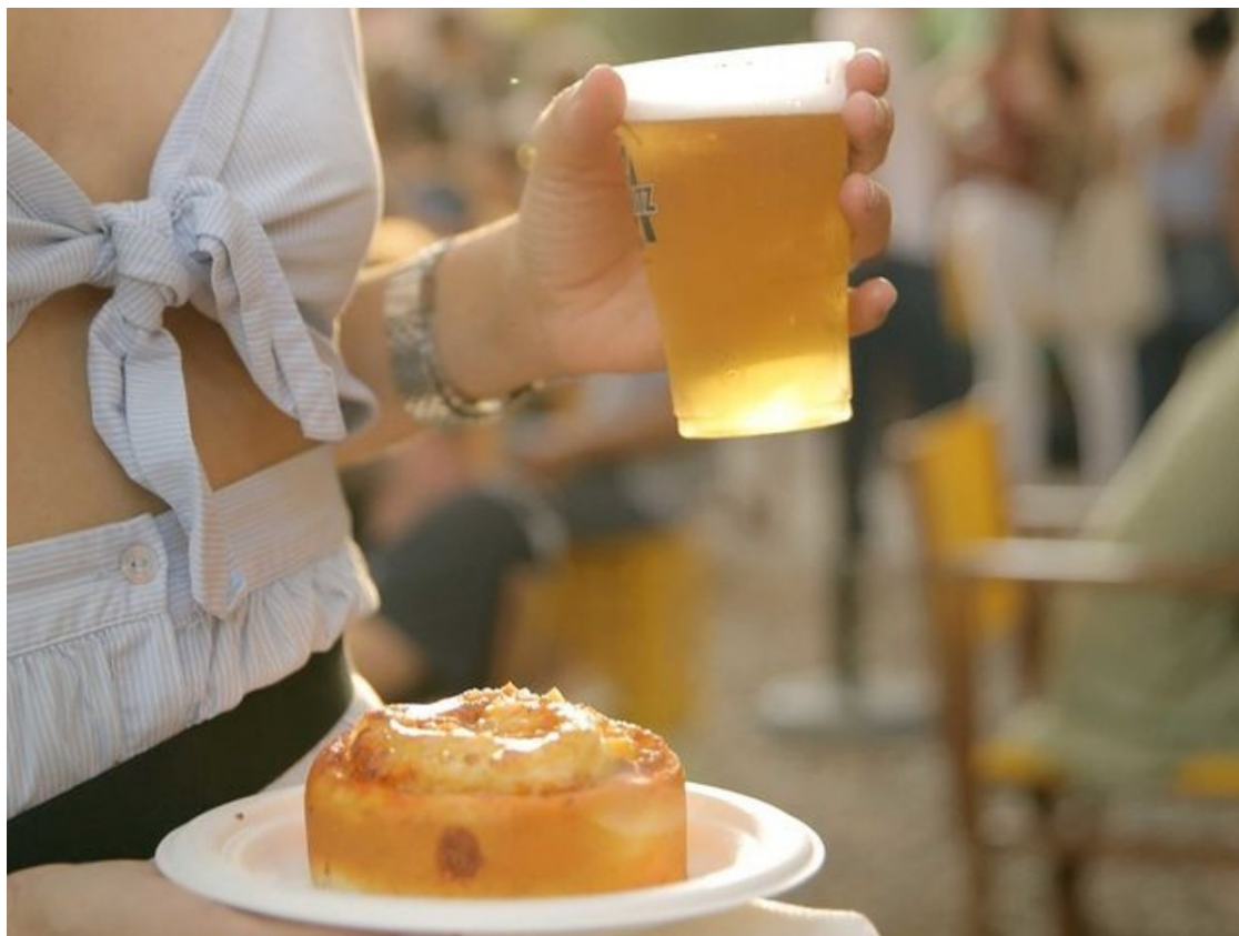
Palo Market Fest 2021. | Palo Market Fest.

Agenda d'activitats gastronòmiques per al cap de setmana de 30 de juliol a l'1 d'agost.