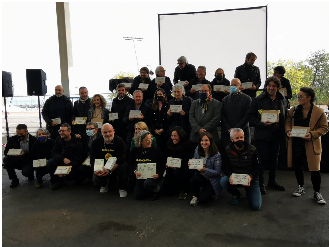
Premiats de l'edició 2022. | Guia de Vins de Catalunya.

Tres vins escumosos han estat els vins millor puntuats a l'edició d'enguany.