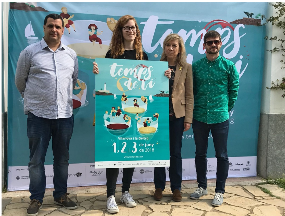
Presentació del cartell de la 7a edició de Temps de Vi a Vilanova i la Geltrú

La fira vinícola Temps de Vi ha donat avui el tret de sortida a la seva 7a edició amb la presentació del cartell que posa imatge i color a l'edició d'enguany, que se celebrarà el primer cap de setmana de juny (de l'1 al 3) a la Rambla Principal de Vilanova i la Geltrú .