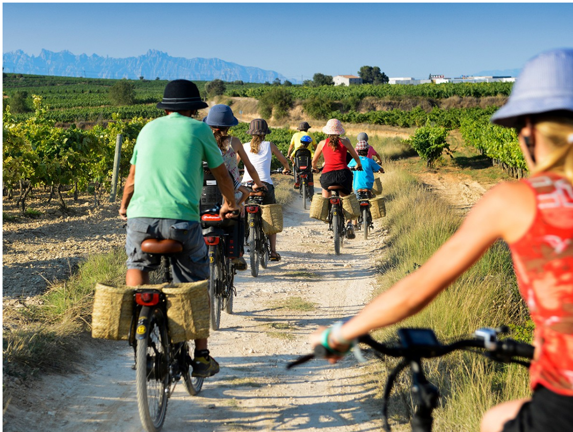
Turisme familiar al Penedès.