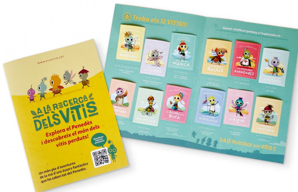
L'àlbum de cromos.