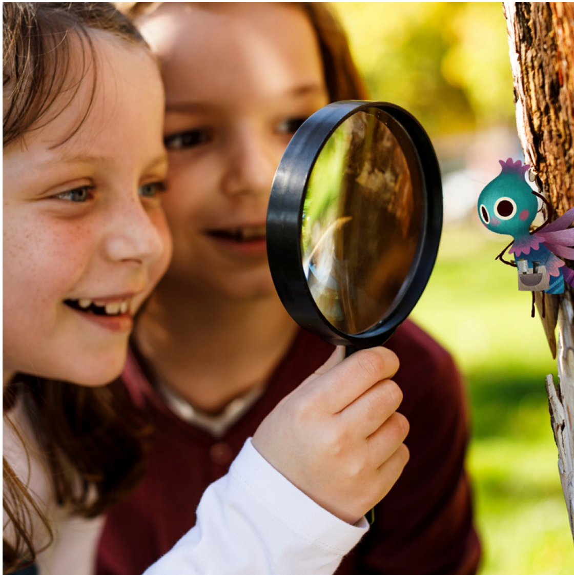
Explora el Penedès i descobreix el món dels Vitis perduts.