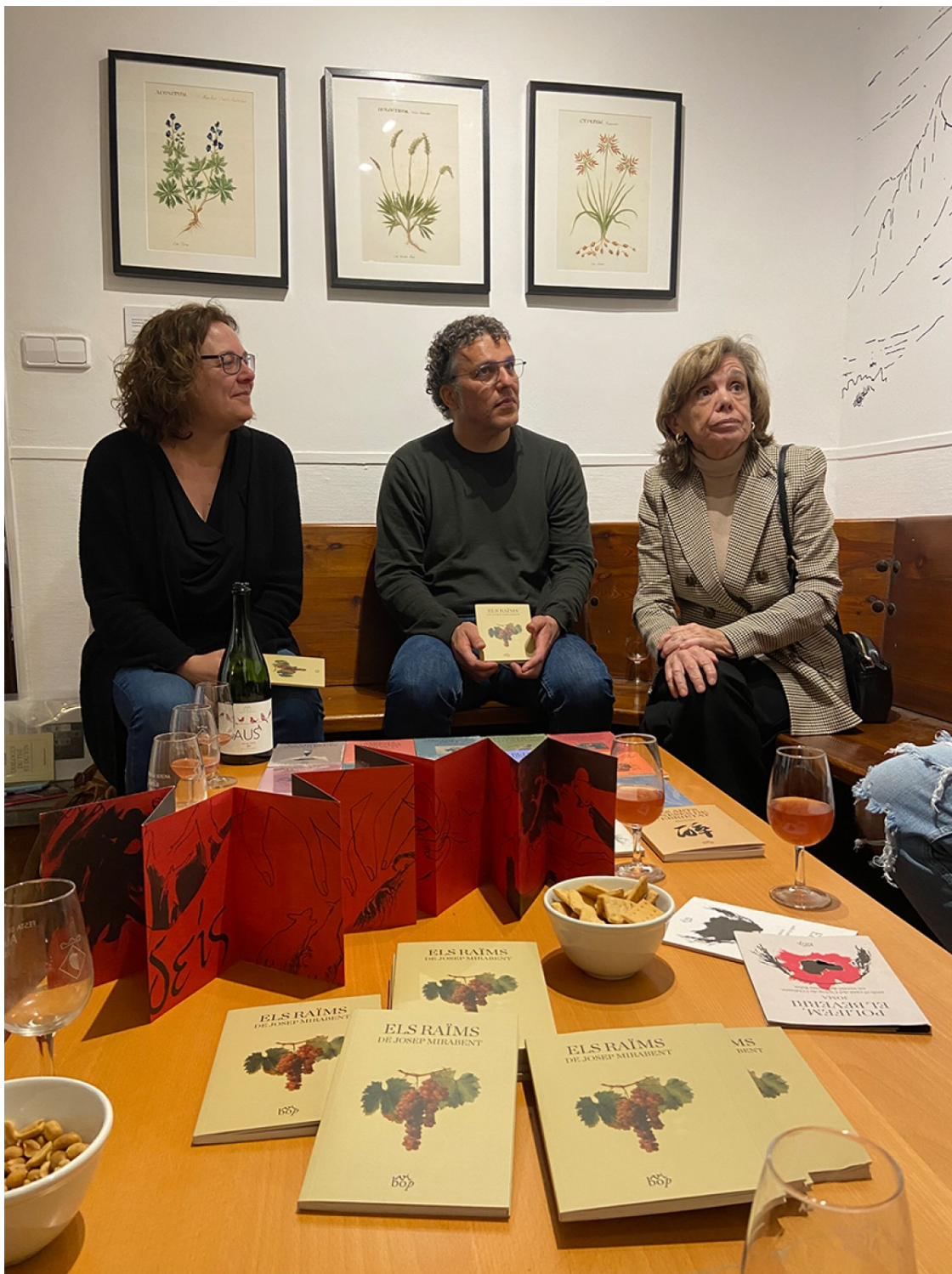
Els raïms de Josep Mirabent.