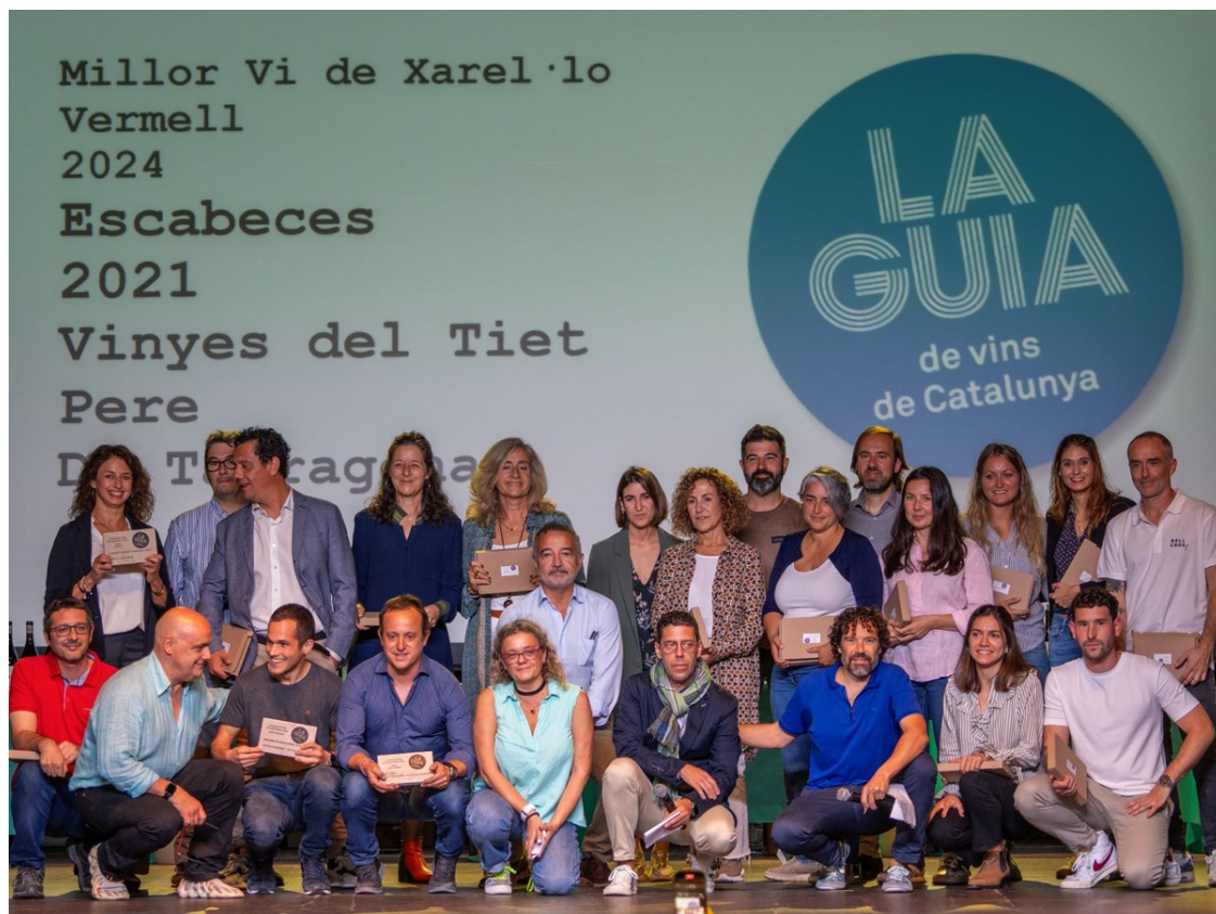
Guanyadors dels Millors Vins.

Memòries del Priorat , Costers del Priorat, DOQ Priorat