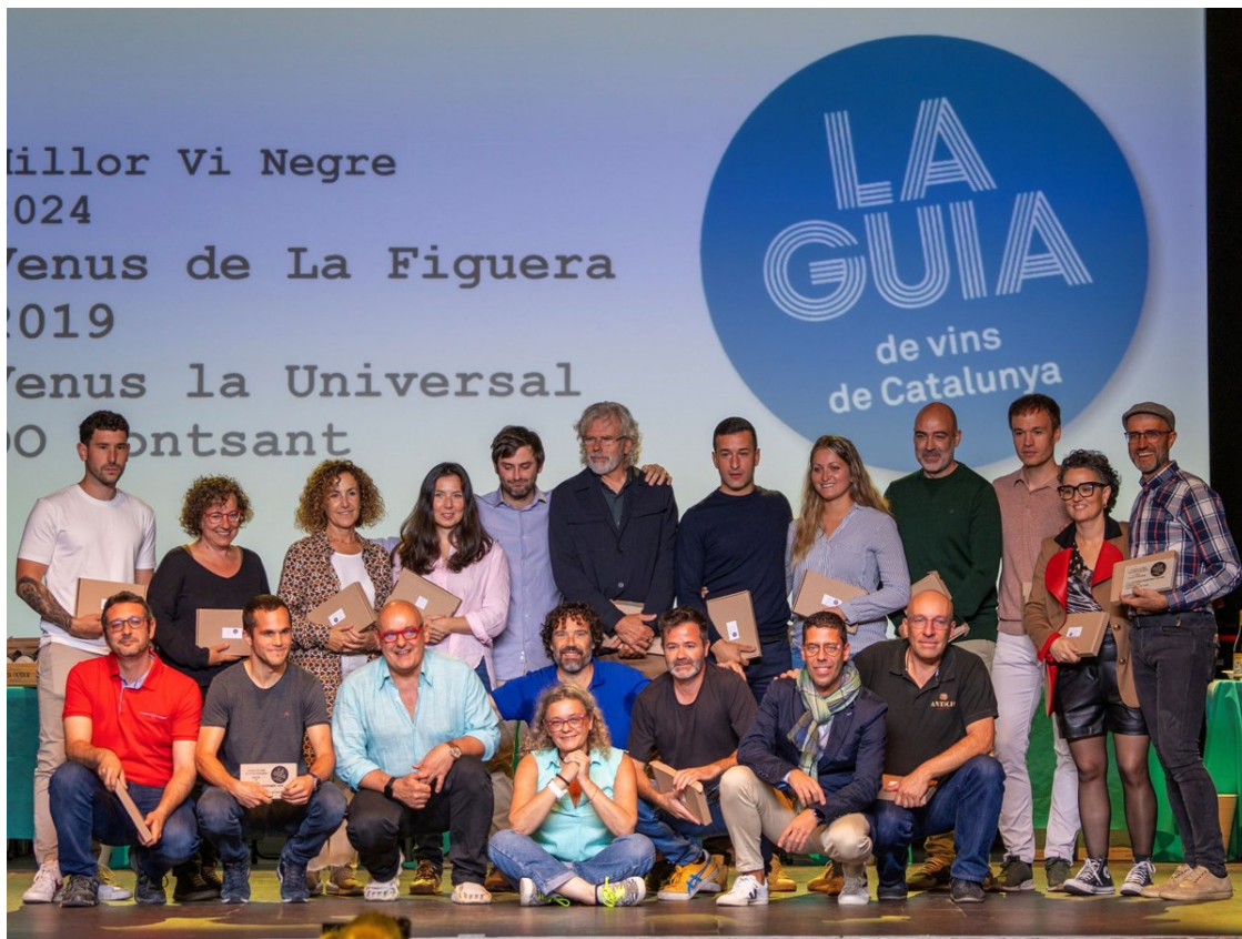
Guanyadors de les Varietals.

A la gala de lliurament dels Premis als Millors Vins de La Guia també s'ha fet l'entrega de tres Premis Honorífics i el premi als vins millor puntuats. A més, i per primera vegada, s'ha estrenat la categoria de millor vermut al marge de les categories tradicionals. Els premiats han estat: