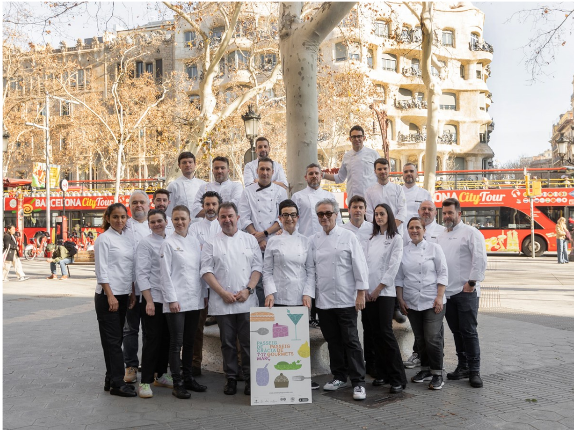
Els xefs del Passeig de Gourmets. | Diana Segura.

El festival gastronòmic del Passeig de Gràcia torna del 7 al 17 de març de 2024, per setè any consecutiu, i juntament amb 20 restaurants