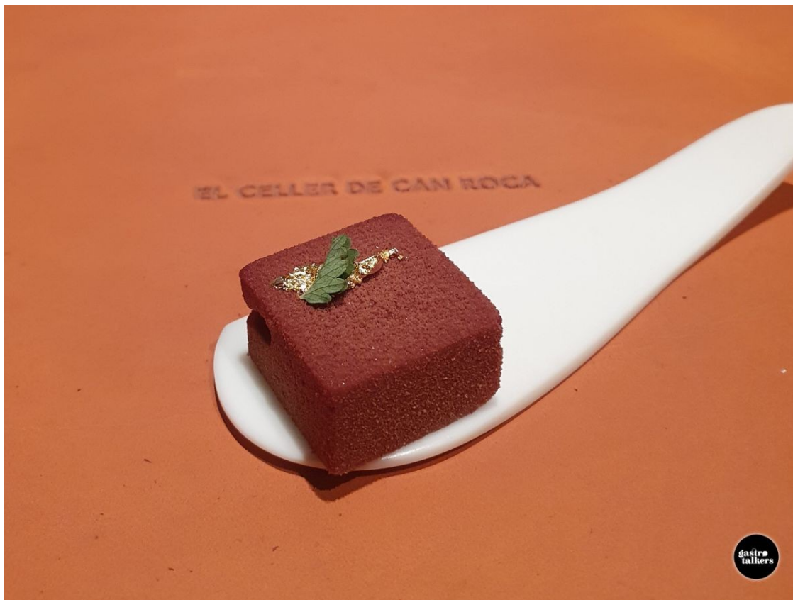
Plat icònic d'El Celler de Can Roca. Menú Juliol del 2020.

Al nou ROCA Sant Julià, el primer a obrir les seves portes serà el restaurant Esperit Roca. Inicialment oferirà dos menús degustació , el '6/2', que proposa sis plats salats i dues postres, i el '2/6', que ofereix dos plats salats i sis de postres. Però també hi haurà una proposta basada en la reinterpretació dels plats icònics d'El Celler de Can Roca . La voluntat dels tres germans és que el nou restaurant sigui "la continuació del Roca Mas Marroch" que a partir d'ara es dedicarà en exclusiva a la celebració d'esdeveniments. El restaurant estarà ubicat a la planta baixa.