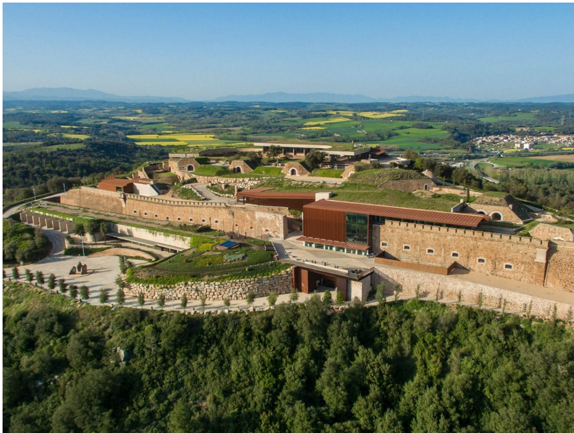
La Fortalesa de Sant Julià.

El Castell de Sant Julià de Ramis, ubicat a la muntanya dels Sants Metges, és una antiga fortalesa militar de finals del segle XIX que no va arribar mai a exercir com a tal i que es va construir al costat d'un poblat iber que es deia Kerunta. En aquest mateix espai, durant un temps, també hi va haver el restaurant A Tempo (actualment ubicat a la ciutat de Barcelona) del xef Jordi Cruz.