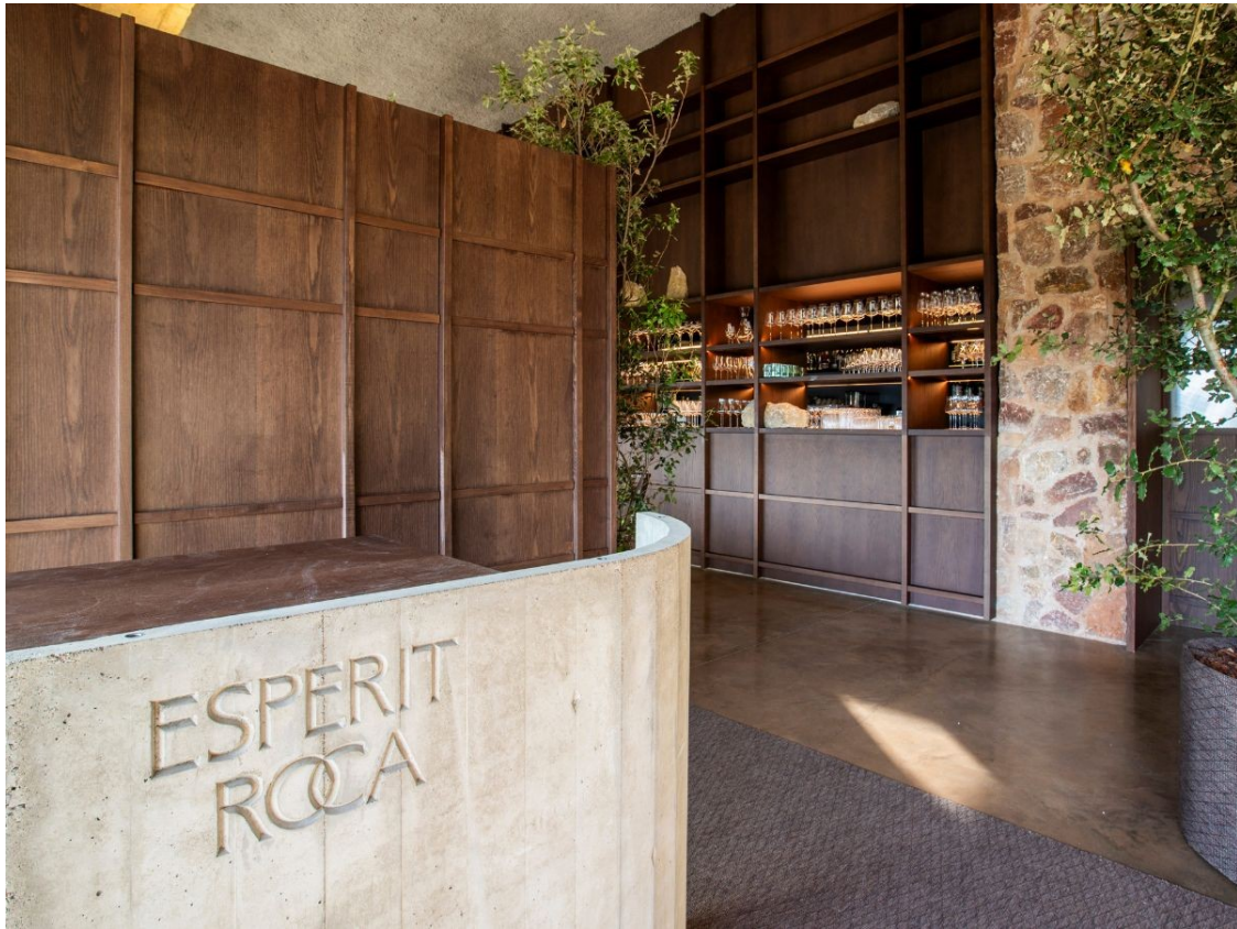
Entrada del nou restaurant Esperit Roca a Sant Julià de Ramis.

El projecte contmpla una estada d'onze anys en aquesta espai privilegiat i el què si farà, així com la seva distribució, és fel resultat d'un any de reflexió i anàlisi de cada racó. La posada en marxa d'aquest nou espai a l'antiga fortificació la van donar a conèixer l'estiu del 2022.