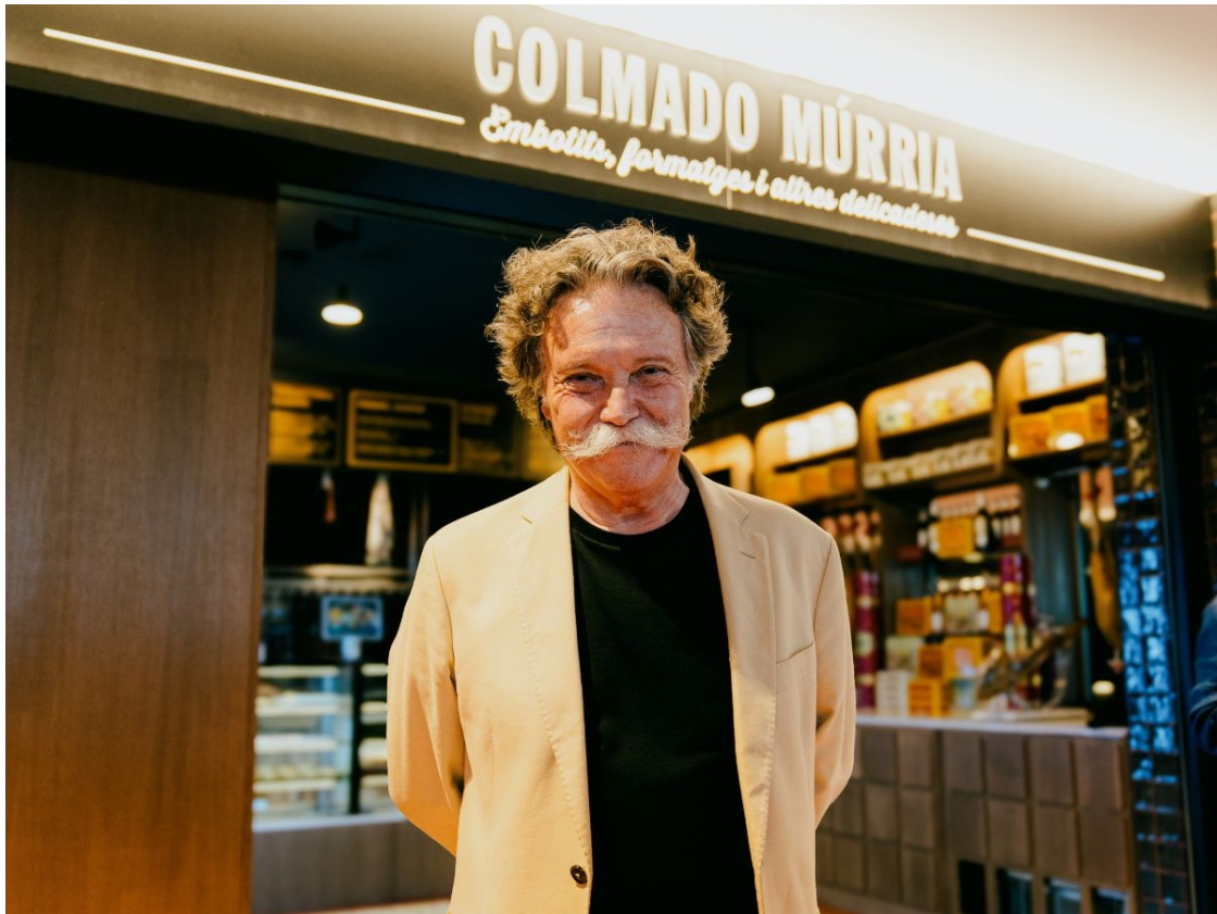
El propietari del Comado Múrria davant la nova botiga al Time Out Market Barcelona.