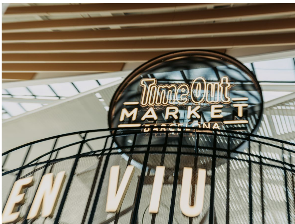
Brànding del nou espai Time Out Market Barcelona. | Time Out Market Barcelona

Des de xefs consolidats a talents emergents: Time Out Market Barcelona compta amb les millors propostes gastronòmiques i experiències culturals de la ciutat de Barcelona