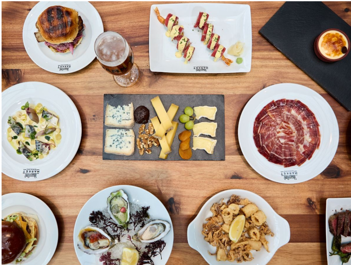
Mostra d'alguns dels tastets que hi ha al Time Out Market Barcelona.