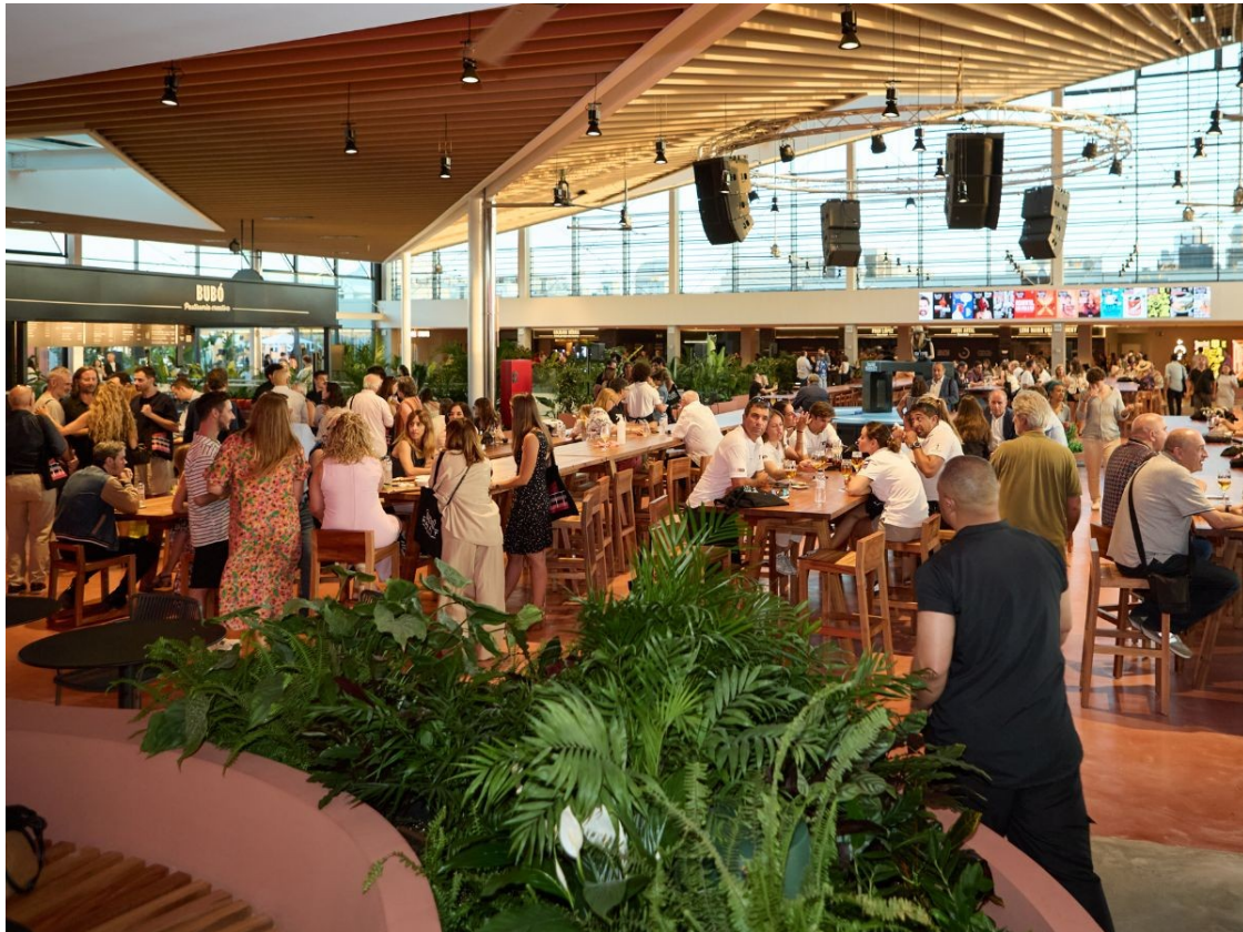
Gent durant la inauguració del Time Out Market Barcelona.