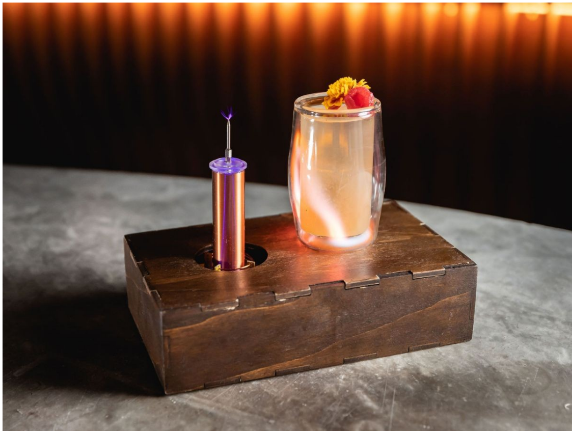
Còctel de la cocteleraia Paradiso.